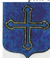
de Buffevent Seigneur de Ternay

On suppose que cette très belle salle du 16 e siècle était à l'origine un élément d'une tour placée sur les ramparts à la porte d'entrée des « Mornandières »