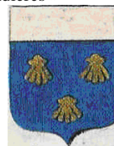
du Bourg Seigneur de Ternay