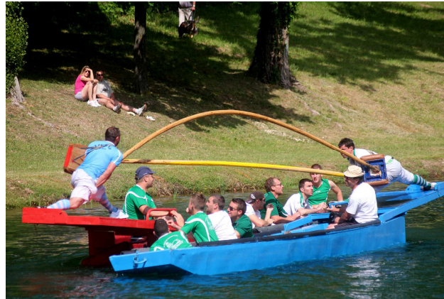
Joute en méthode givordine

1967 - 2015 : Le bassin se modernise au fil du temps. Le club poursuit son évolution. Les résultats sportifs progressent : nombreux sont les titres de champion de France ou de places d'honneur obtenus.