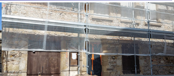
La façade des bâtiments conventuels, place de l'Église

Le MOT du Maire : Ces travaux ont pour objectif la revalorisation de ce bâtiment historique avec la mise en valeur de la place de l'Église avant une restauration générale.