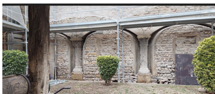
Le cloître avant et après décaissage (février 2024). Plusieurs ouvertures ont été mises à jour. L'hypothèse d'une baie à meneau a été vérifiée