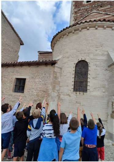
Un groupe de scolaires admirant les modillons (sculptures en ligne sous le toit ornant le chevet de l'église) lors des Journées Européennes du Patrimoine.

Cluny et les Sites Clunisiens Candidature Patrimoine Mondial