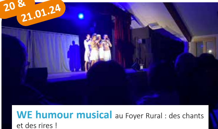
WE humour musical au Foyer Rural : des chants et des rires !