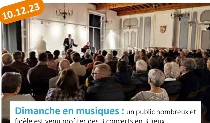
Dimanche en musiques : un public nombreux et fidèle est venu profiter des 3 concerts en 3 lieux.