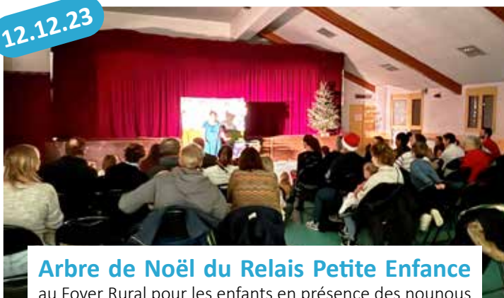
Arbre de Noël du Relais Petite Enfance au Foyer Rural pour les enfants en présence des nounous et des parents.