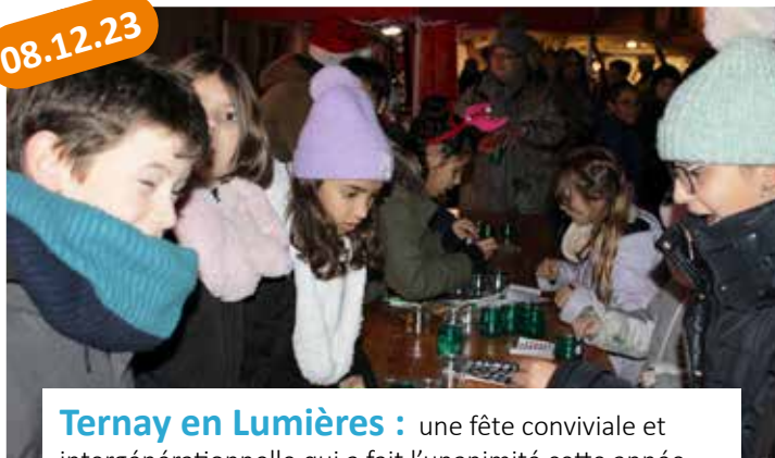
Ternay en Lumières : une fête conviviale et intergénérationnelle qui a fait l'unanimité cette année encore.