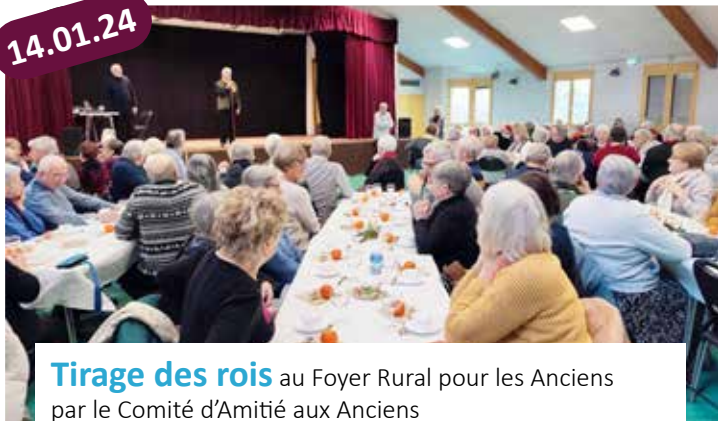
Tirage des rois au Foyer Rural pour les Anciens par le Comité d'Amitié aux Anciens