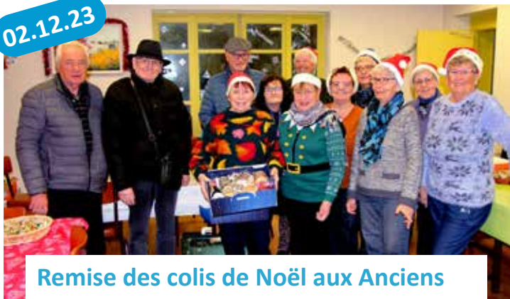
Remise des colis de Noël aux Anciens