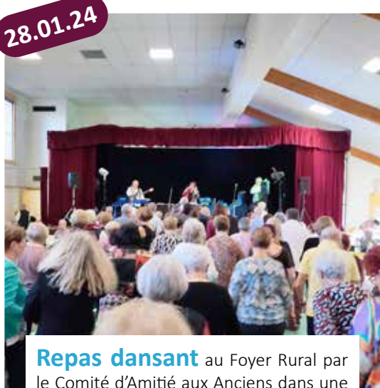
Repas dansant au Foyer Rural par le Comité d'Amitié aux Anciens dans une chaude ambiance.